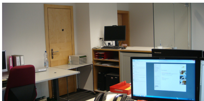
Den Diskretschalter finden Sie direkt nebenan im Büro 2.

Das Frontoffice ist nicht nur die erste Anlauf- und Beratungstelle für die Bürgerinnen und Bürger. Am offenen Schalter werden weiterhin alle Dienstleistungen des Einwohnerwesens wie An- und Abmeldungen, Ausstellung von Identitätskarten, Verlängerung der Ausländerausweise, Beglaubigungen, Verkauf von Tages-GA's, Park- und Velokarten, Verkauf von Containerplomben und vieles mehr angeboten. Der offene und grosszügige Eingangsbereich wird in den nächsten Tagen noch fertiggestellt.