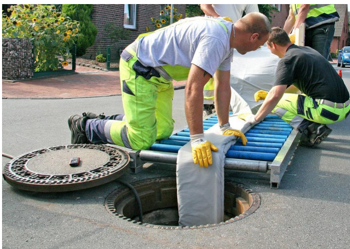
Der in Harz getränkte Textilschlauch wird im beschädigten Rohr mit Hilfe von Druckluft eingebaut. Das defekte Rohr wird so komplett neu ausgekleidet.

Der Werterhaltung der Kanalisationsleitungen im Boden wird in Zukunft grosse Bedeutung beigemessen. Die Dichtigkeit der Schmutzwasserleitungen und die Einhaltung der gewässerschutztechnischen Vorschriften beziehungsweise die Bewahrung unseres Grundwassers vor Verschmutzungen muss ständig im Auge behalten werden. Entsprechend werden die öffentlichen Leitungen in regelmässigen Abständen gespült und gefilmt. Dabei werden undichte Stellen und andere Mängel aufgedeckt und die erforderlichen Massnahmen in einer rollenden Planung der anstehenden Investitionen berücksichtigt.