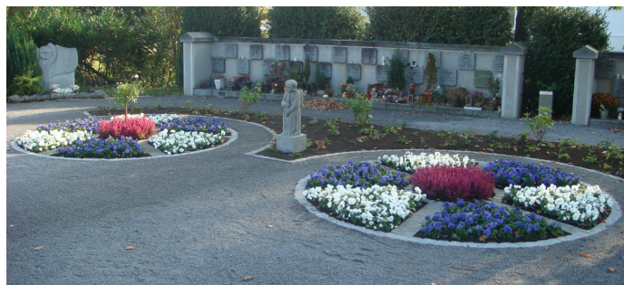
Das neue Kindergrab beim Friedhof Heerbrugg.