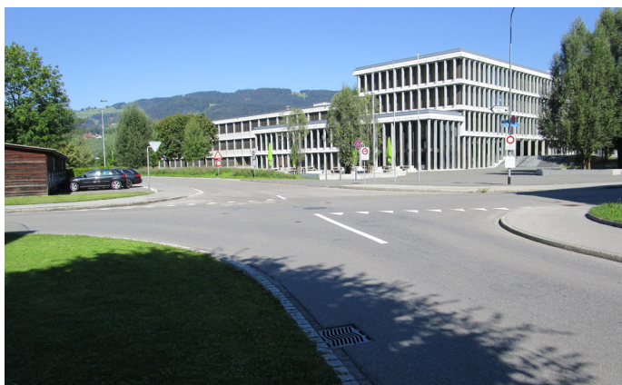
Im Gebiet Blattacker werden Massnahmen zur Verkehrssicherheit umgesetzt.

Seit 2010 beabsichtigt der Gemeinderat im Gebiet Blattacker, Heerbrugg eine Tempo 30 Zone einzuführen. Einsprachen haben die Realisierung bis heute verhindert. Gemäss Verwaltungsgerichtsurteil zur letzten Einsprache, habe sich am Projektanfang ein Verfahrensfehler ergeben. Entsprechend müsste das Projekt von Anfang an neu aufgearbeitet werden. Damit die Verkehrssicherheit im Blattacker so bald wie möglich verbessert werden kann, hat der Gemeinderat deshalb entschieden, das Projekt Tempo 30 Blattacker nicht weiter zu verfolgen. Stattdessen werden im Rahmen der Strassensanierungen Verkehrsberuhigungen als erste Massnahmen umgesetzt und weitere geplant.