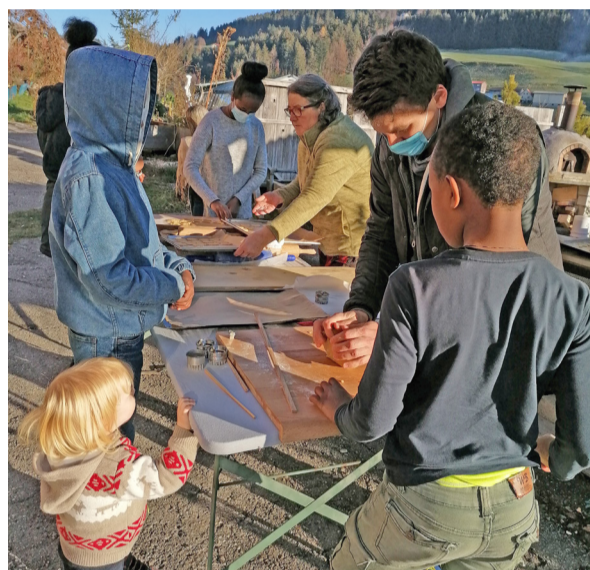
Die selbstgebackenen Weihnachtsguetzli kamen bei den Bewohnerinnen und Bewohnern sehr gut an.