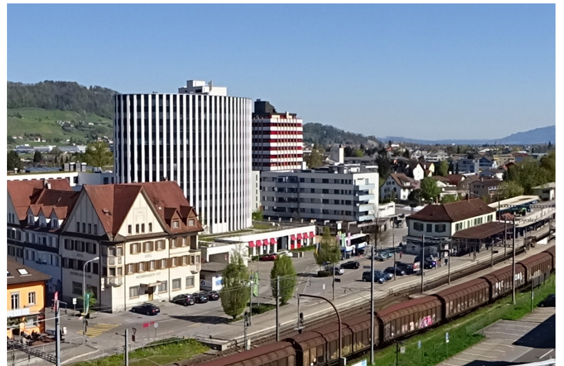
2020 wurden wieder zahlreiche Fotos von Au und Heerbrugg eingereicht.

Wer hat schöne Fotos von der Gemeinde Au, welche Heimatgefühle zeigen? Jede Fotografin und jeder Fotograf sieht unsere Gemeinde aus einem anderen Blickwinkel. Auch im Jahr 2021 gibt es für alle Fotografen die Chance, die schönsten Fotos einer breiten Öffentlichkeit zu zeigen. Die Teilnahmebedingungen sind: Jeder Teilnehmer und jede Teilnehmerin kann maximal zehn Fotos bis am 19. November 2021 auf einem Datenträger bei der Gemeinderatskanzlei, Kirchweg 6, 9434 Au, oder per E-Mail an marcel.fuerer@au.ch einreichen. Mit der Teilnahme treten Sie die Fotorechte an die Gemeinde ab. Die schönsten Fotos werden an der nächsten Neujahrsbegrüssung präsentiert. Die Fotos aus dem Jahr 2020 werden an einem geeigneten nächsten Anlass präsentiert. Das Formular für die Übertragung der Bildrechte an die Politische Gemeinde Au finden Sie auf www.au.ch unter dem Stichwort Fotowettbewerb.