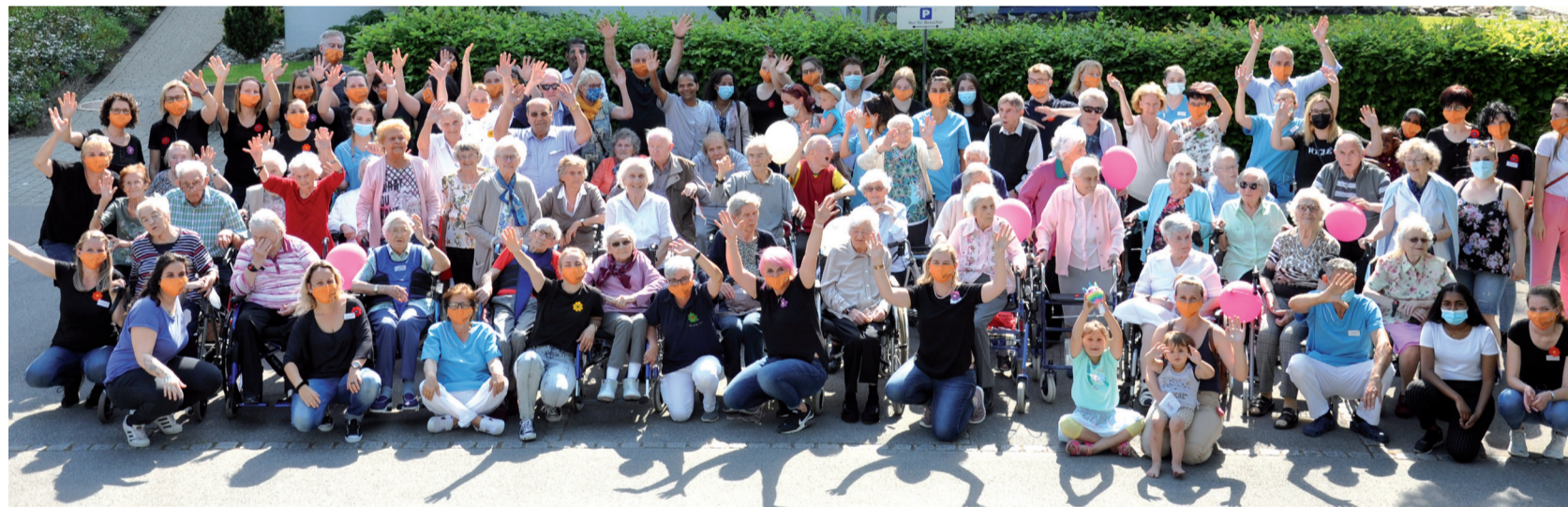
Impressionen vom Jubiläumsfest im Alters- und Pflegeheim Hof Haslach.