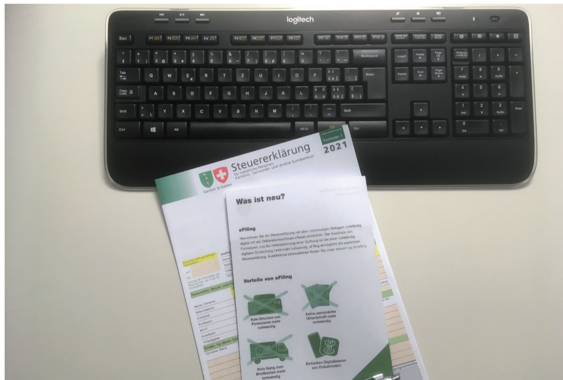
Mit der neuen, bequemen Möglichkeit leisten Sie einen aktiven Beitrag zur Digitalisierung im Steuerwesen und schonen zudem auch noch die Umwelt.

Auskünfte zur Steuererklärung Nutzen Sie die neue, bequeme Möglichkeit und leisten Sie damit einen aktiven Beitrag zur Digitalisierung im Steuerwesen, unserer Umwelt zuliebe. Haben Sie Fragen zur Steuererklärung? Die Mitarbeiterinnen und Mitarbeiter des Gemeindesteueramtes (Tel. 058 228 62 50 oder E-Mail: steueramt@au.ch ) beantworten diese gerne. Neu steht auch der LiveChat unter www.steuern.sg.ch/efiling zur Verfügung, wo Ihre Steuerfragen von Expertinnen und Experten beantwortet werden.