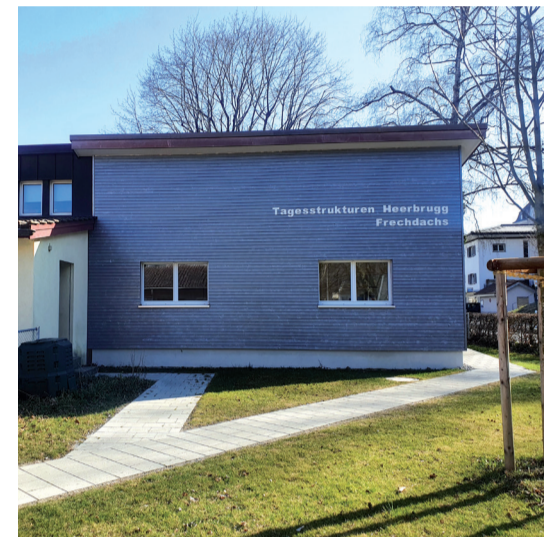
Der Anbau der Tagesstruktur Frechdachs in Heerbrugg.

Am Samstag, 14. Mai 2022 findet von 10.00 bis 14.00 Uhr in der Tagesstruktur Frechdachs, Heer-brugg, einen Tag der offenen Tür statt. Lernen Sie das neue Team in den Tagesstrukturen Au-Heerbrugg persönlich kennen und besichtigen Sie unsere neuen Räumlichkeiten, die durch den Anbau gewonnen wurden. An diesem Tag erfahren Sie mehr über das Angebot und die Arbeit in den Tagesstrukturen. Am Tag der offenen Tür bieten wir auch den Kindern ein vielfältiges Angebot. So können sie an einem von unseren verschiedenen Bastelangeboten ihrer Kreativität freien Lauf las-sen. Es wird Schlangensbrot (Stockbrot) auf dem Feuer gemacht oder man kann sich zum schaurig schönen Fabelwesen oder zur Eiskönigin schmin-ken lassen. Tauchen Sie und Ihr Kind in die bunte Vielfalt der Tagesstrukturen ein. Wir freuen uns sehr auf euren Besuch.