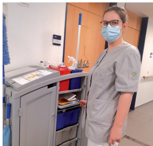
Die Gemeinde Au bietet vielseitige und interessante Lehrstellen in verschiedenen Berufsfeldern an.