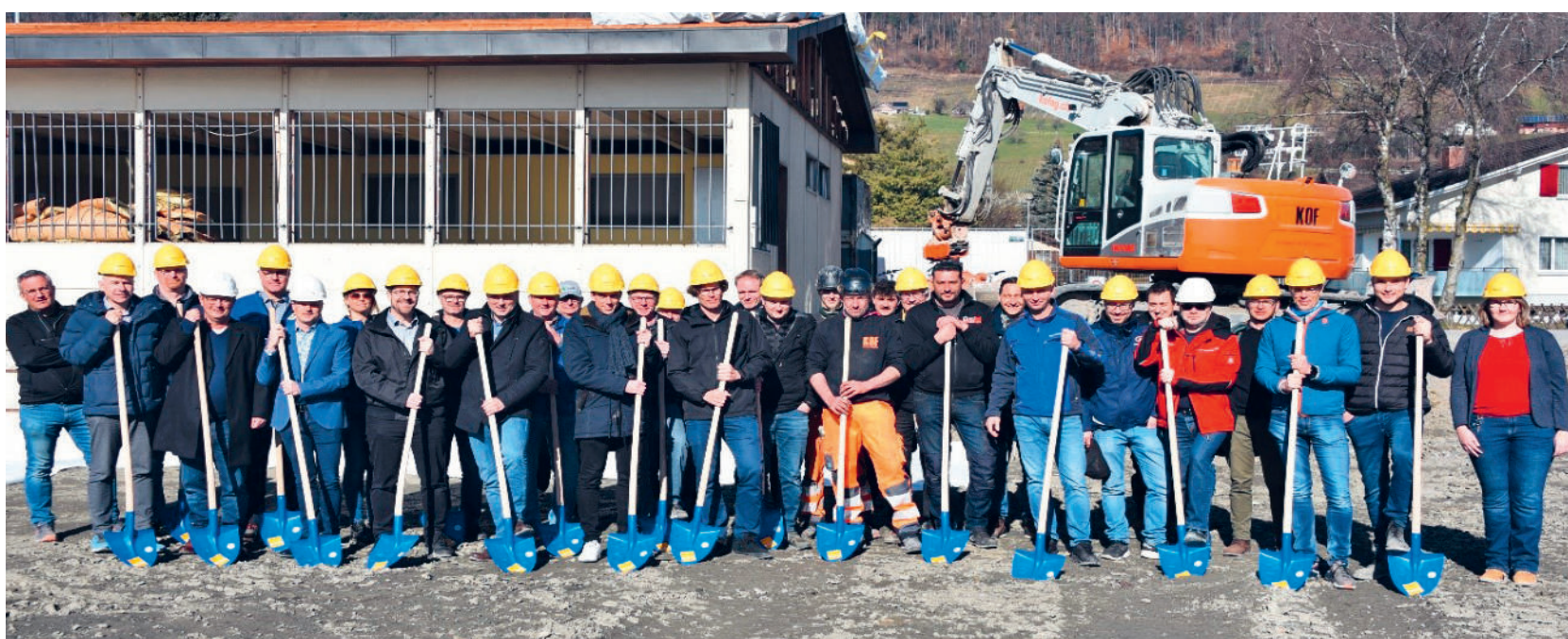
Spatenstich vom 21. Februar 2023.