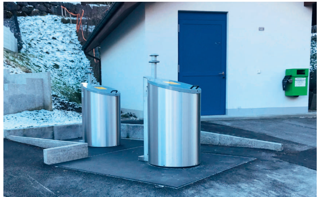
Neu in Betrieb genommene Unterflursysteme an der Büchelstrasse in Au

Daniel Hutter, Bereichsleiter Unterhalt/Werke per E-Mail: daniel.hutter@au.ch oder Telefon: 058 228 62 04 mitgeteilt werden.