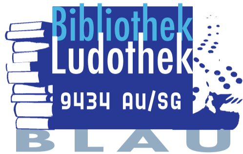
Logo der Bibliothek Ludothek Au