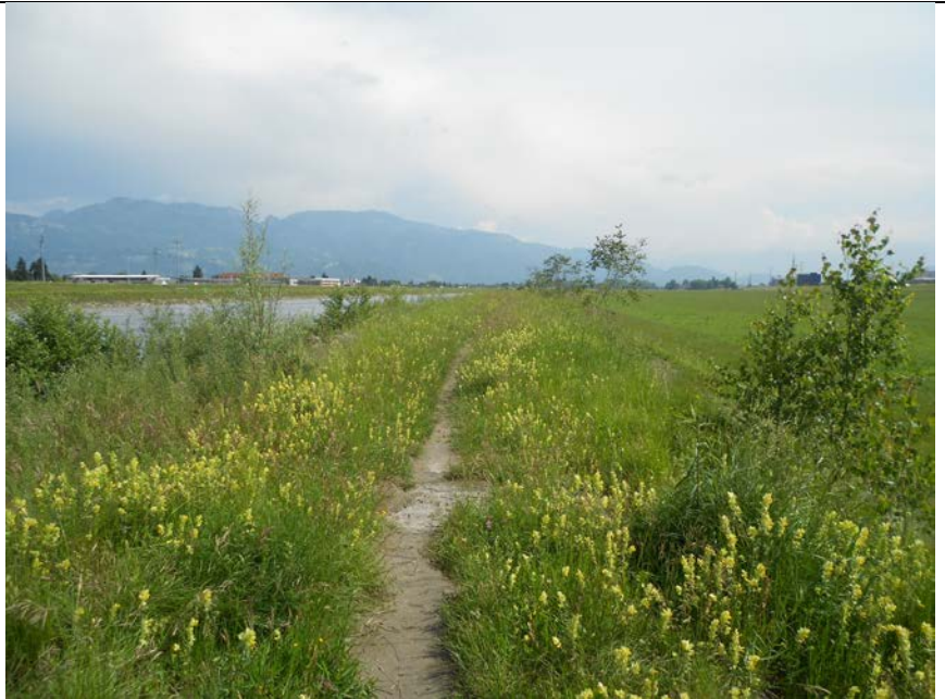
Abb. 1: Halbtrockenrasen entlang Mittelwuhrkrone (, 07.06.2016)