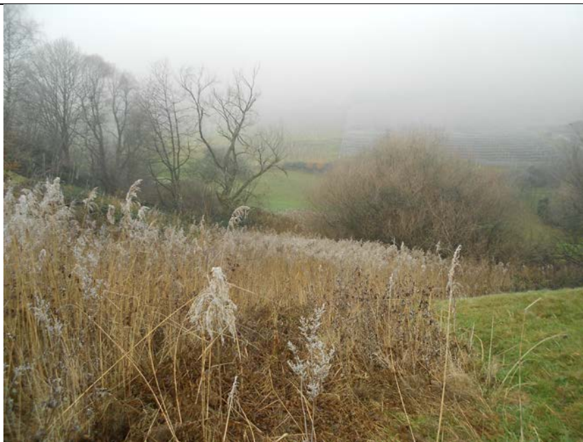
Abb. 1: Schilffläche entlang des Haldenbachs (, 08.12.2016)