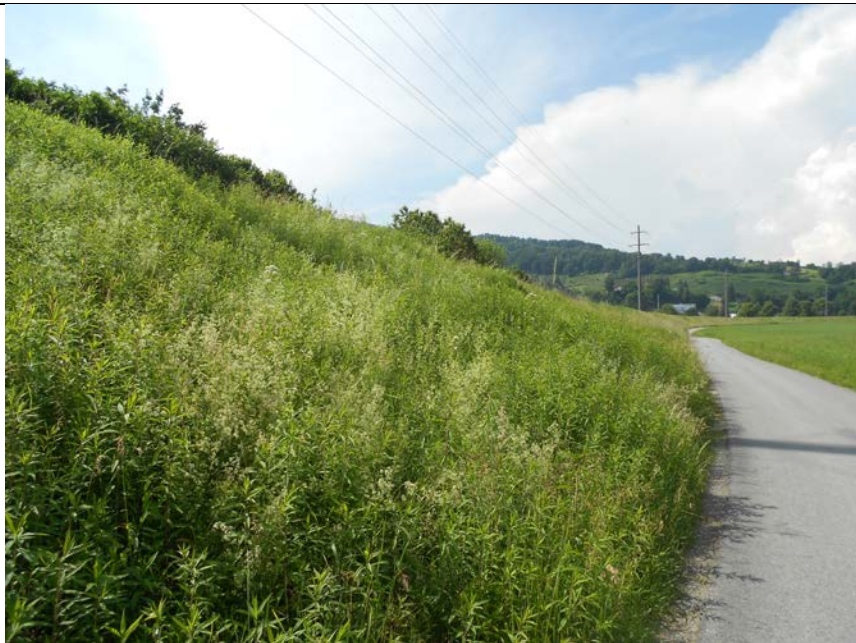
Abb. 1: Grossflächiger Bestand von Goldruten durchsetzt mit Galium album (, 07.06.2016)