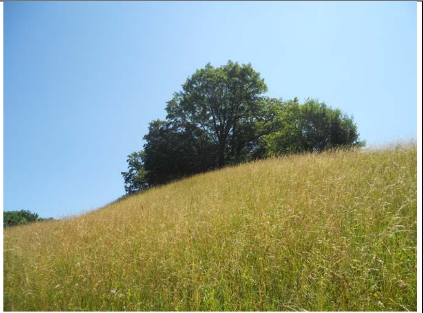
Abb. 1: Halbtrockenrasen (Mesobromion)