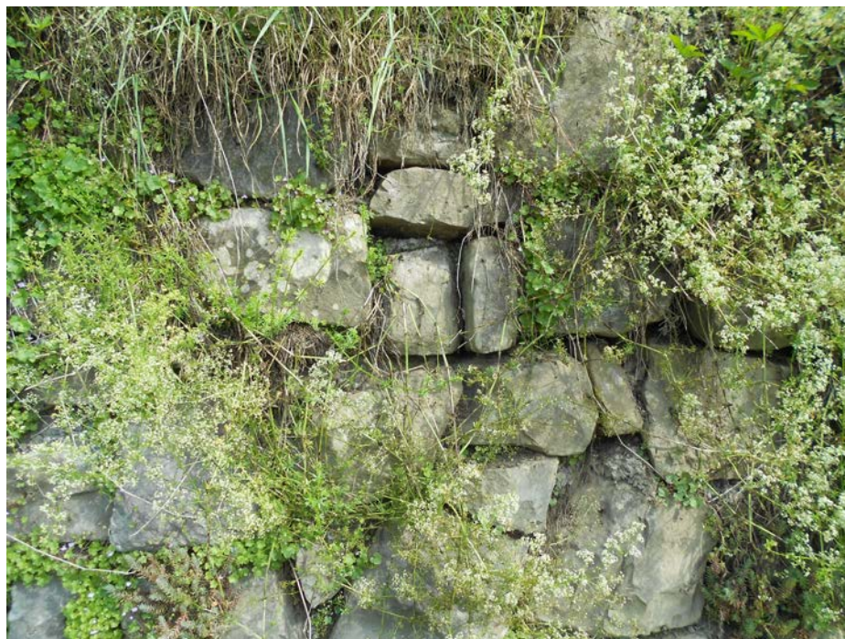
Abb. 1: Punktuell mit Mörtel geflickte Trockenmauer, welche als Schutzobjekt erfasst wurde.