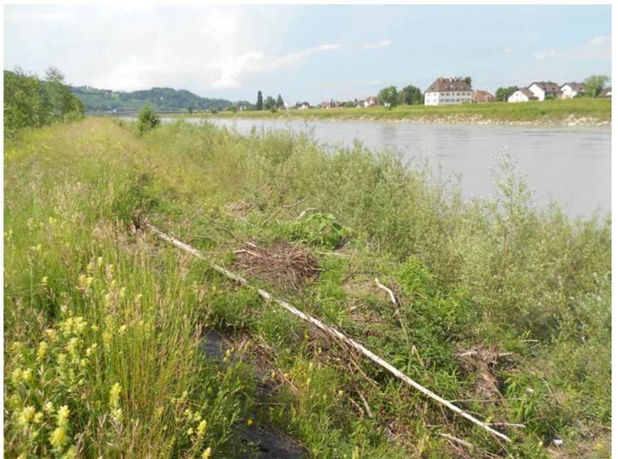
Abb. 2: Mittelwuhr rheinseitig hauptsächlich mit Weiden bestockt und Trockenvegetation