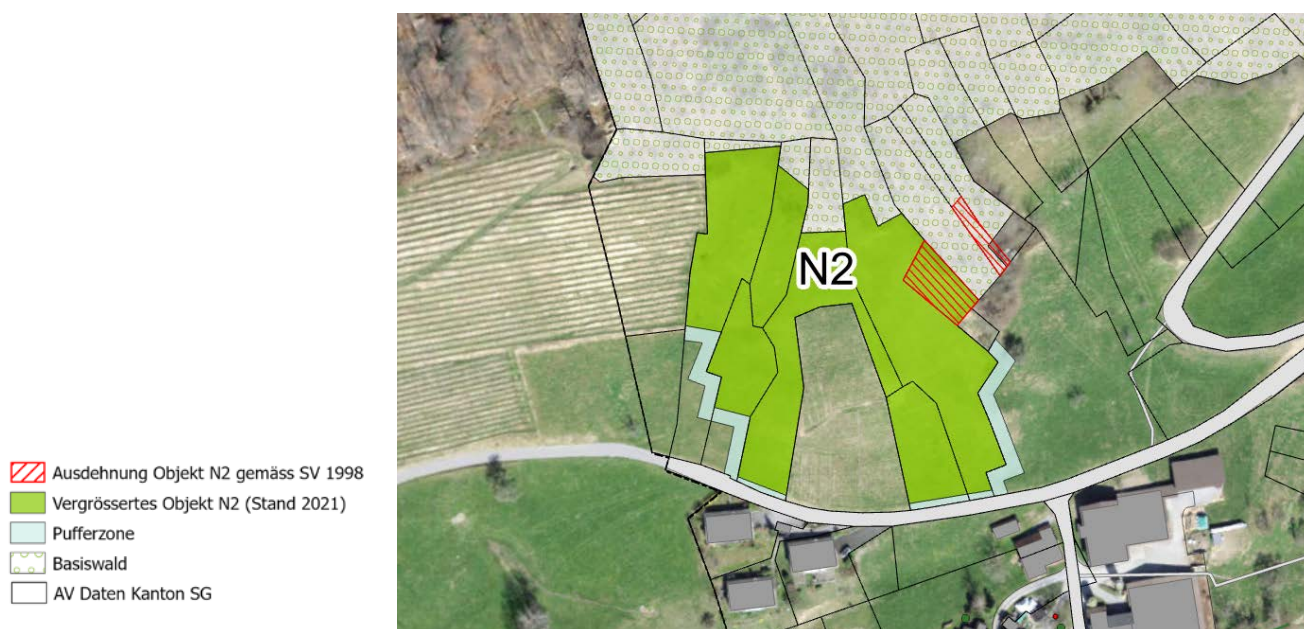
Abb. 3: Situation Objekt N2.

Das Objekt N2 (Objekt Nr. 105 gemäss SV von 1998) wird gegen Westen hin stark vergrössert (Abb. 3). Es handelt sich dabei um artenreiche Mitteleuropäische Halbtrockenrasen Mesobromion . Der östliche Teil des Objektes auf Parzelle 1600 wird aus der Schutzverordnung entlassen, da diese Fläche heute verwaldet ist (siehe auch Kapitel 4.2.1). Die Naturschutzfläche wurde neu bis zum angrenzenden Rebberg vergrössert. Der Eintrag von Nährstoffen über die Rebbergflächen sowie den östlich gelegenen Beerengarten wird bei hangparalleler Ausrichtung als vernachlässigbar erachtet. Deshalb wurde im nordwestlichen Bereich, in der Mitte der Fläche sowie im Osten beim Beerengarten auf die Ausweisung einer Pufferzone verzichtet.