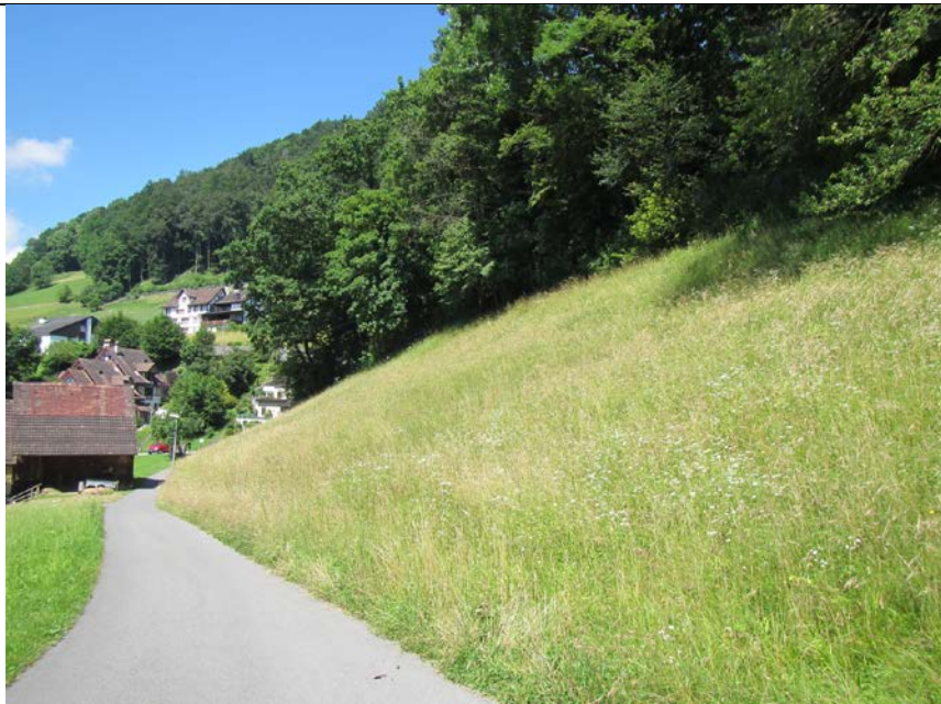
Abb 1: Halbtrockenrasen (Mesobromion)