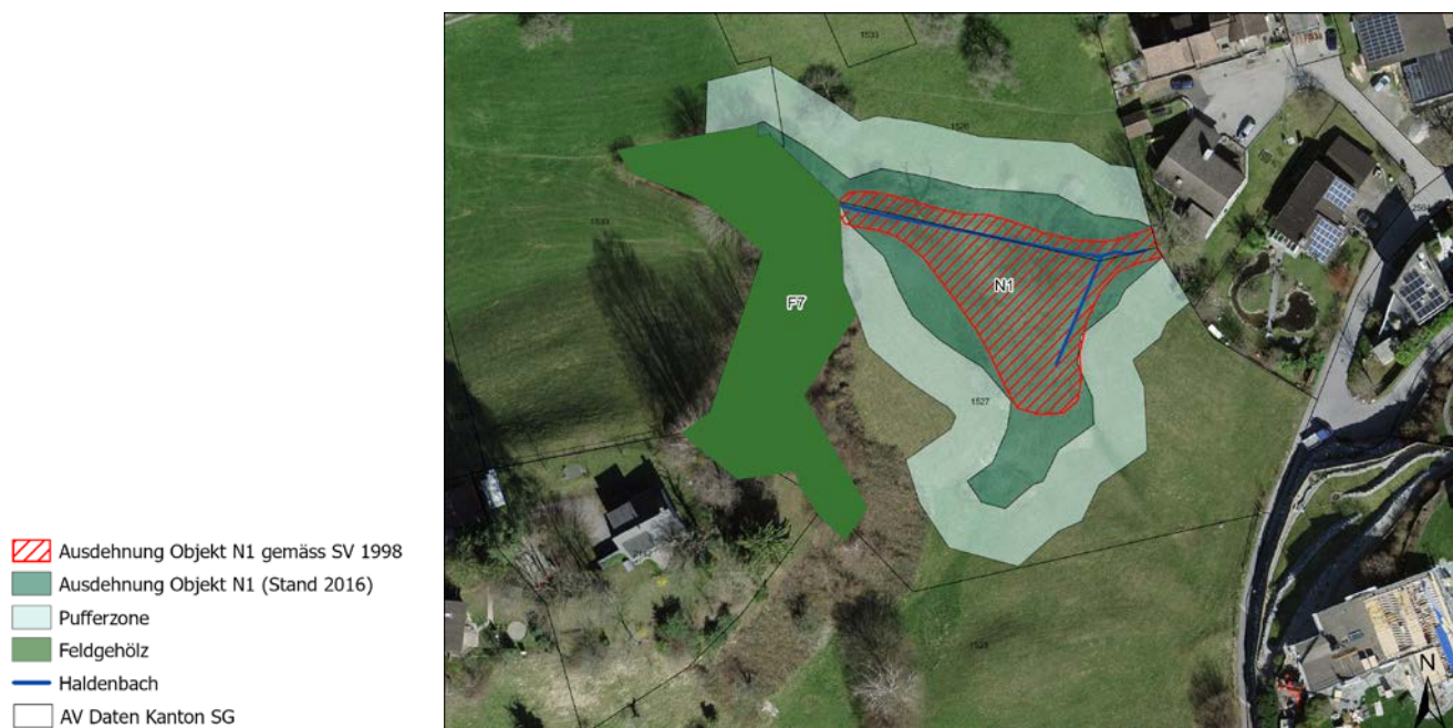
Abb. 2: Situation Objekt N1.

Der Perimeter des Objektes N1 (Objekt Nr. 104 gemäss SV von 1998) auf der Parzelle 1527 wurde gemäss seinem jetzigen Bestand angepasst (GPS-Vermessung). Es handelt sich um eine Fläche, welche entlang des Haldenbaches hauptsächlich mit Schilf bewachsen ist (Abb. 2). Im westlichen Teil der Fläche dominiert Brombeergestrüpp. Entlang des Bachlaufes befinden sich einige grosse Bäume, stehendes Totholz (Spechtbäume) und Sträucher. Die Ausdehnung der Fläche umfasst heute die Parzellen 1526, 1527 und 1530.