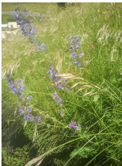
Abb. 2: Salvia pratensis (Wiesensalbei)