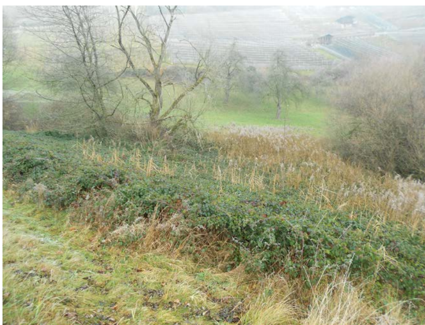
Abb. 2: Brombeergestrüpp welches die Schilffläche überwuchert