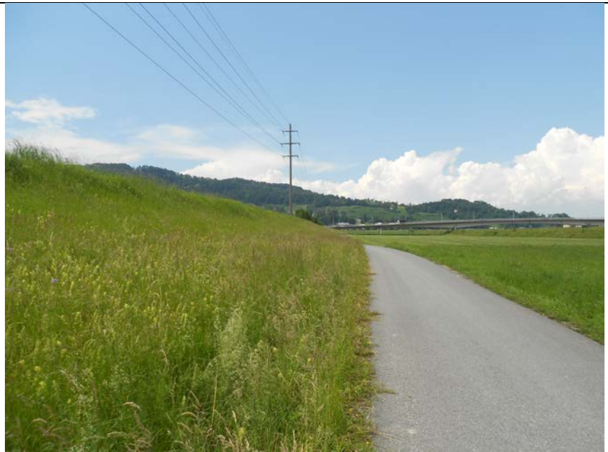
Abb. 1: Hochwasserdamm Böschung