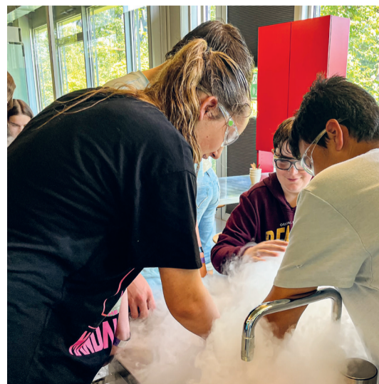
Die Schülerinnen und Schüler aus Heerbrugg stellen mit rauchendem, flüssigem Stickstoff eigenhändig Himbeereis her.

ein kabelloses Smartphone-Ladegerät – einen sogenannten Qi-Charger – kreativ gestalten können. Rund 1'000 Grundkörper aus Holz seien von den Schulen bestellt worden, betont Letizia Wenger. Im Rahmen des Berufsevents vom 16. und 17. November 2023 in der Schöntalhalle in Altstätten können die Grundkörper dann zum fertigen Ladegerät montiert werden.