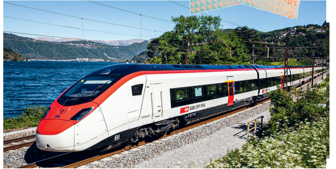
Das bisherige Angebot der «Tageskarte Gemeinde» ist bis zum 25. September 2023 verfügbar. Ab dem 1. Januar 2024 gibt es die neue «Spartageskarte Gemeinde» zu kaufen.