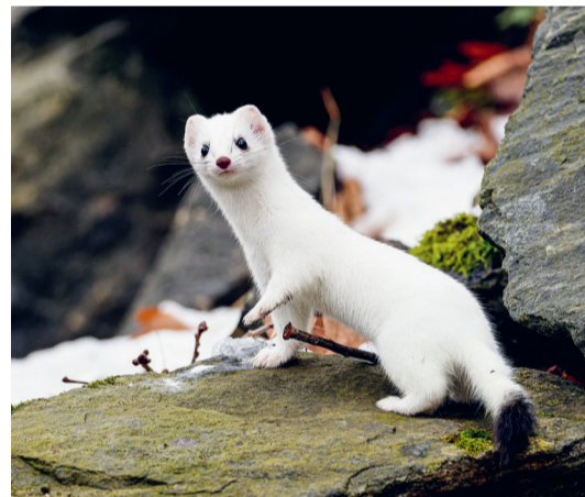
Hermeline wechseln ihr Fell im Winter und werden weiss. Die schwarze Schwanzspitze, an der man sie einfach vom Mauswiesel unterscheiden kann, bleibt.

Der WWF lanciert daher ein Ostschweizer Wieselprojekt, um die kleinen Mäusejäger zu fördern. Um mehr über die Verbreitung der Wiesel zu erfahren, braucht es die Mithilfe aus der Bevölkerung. Haben Sie in Ihrer Gemeinde oder unterwegs ein Hermelin oder Mauswiesel beobachtet? Dann melden Sie es gleich unter www.wildennachbarn.ch/melden oder beim WWF Regiobüro AI/AR-SG-TG, E-Mail: info@wwfost.ch oder Tel. 071 221 32 70. Auch ältere Beobachtungen sind wertvoll und können eingetragen werden. Mehr Infos zum Wieselprojekt finden Sie unter www.wwfost.ch/wiesel