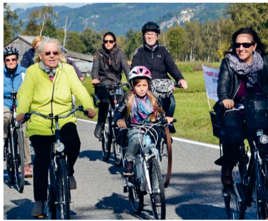
Plan B Rad-Ried-Tag

Beim Plan b-Rad-Ried-Tag werden gemeinsam die Ergebnisse der Aktion «Radkilometer wachsen lassen» und des RADIUS-Fahrradwettbewerbs gefeiert. Anwesende RADIUS-Teilnehmende haben die Chance auf attraktive Gewinne. Der RADIUS-Fahrradwettbewerb läuft übrigens noch bis zum 30. September 2023. Die Anmeldung ist bis dahin möglich unter vorarlberg.radelt.at oder über die Vorarlberg-Radelt-App.