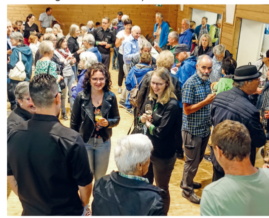
30 Jahre Patenschaft Ortsgemeinde Au mit Unterschächen UR

Teilnehmenden von Au-Heerbrugg und Unterschächen bei volkstümlichen Klängen, einem sehr interessanten Ortsportrait und verschiedenen Darbietungen gefeiert. Die Freude und die Dankbarkeit waren gegenseitig sehr gross. (weitere Bilder www.ortsgemeinde-au.ch )