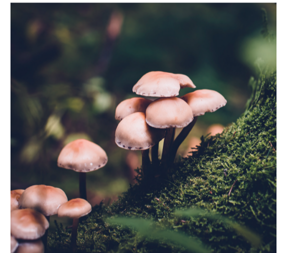
Pilze tragen wesentlich zum Erhalt des ökologischen Gleichgewichtes bei. Sie funktionieren im Prinzip wie ein Kompost.

Bei Fragen oder Unklarheiten steht Ihnen Herr Matzer gerne unter Telefon 071 888 22 41 zur Verfügung. Er ist für die umliegenden Gemeinden zuständig und gibt Ihnen gerne Auskunft.