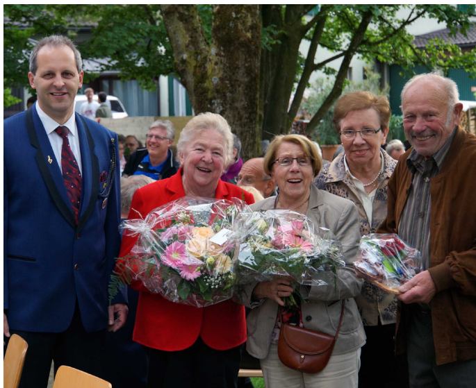
Die Auer Jubilare wurden bereits am 10. Mai 2014 im Rahmen des Muttertagkonzertes des Musikvereins Konkordia Au geehrt.

Die Politische Gemeinde Au hat seit vergangenem Jahr die Tradition der ansässigen Musikvereine aufgegriffen, die Dorfjubilare gemeinsam zu einem Konzert einzuladen. Dort werden sie durch den Gemeindepräsidenten Stefan Suter geehrt. Für die Heerbrugger Jubilare, die in diesem Jahr ihren 80., 90., 95. oder höheren Geburtstag feiern, findet das Konzert am Samstag, 14. Juni 2014, um 16.00 Uhr im Pavillon beim Schulhaus Blattacker anlässlich des Frühlingkonzerts des Musikvereins Heerbrugg statt. Die Jubilare vom Alters- und Pflegeheim Hof Haslach werden am 5. Juni 2014 geehrt.